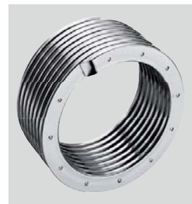
InoX-Radial grijaće površine od visokokvalitetnog nehrđajućeg čelika

Vitodens 100-W jedan je od najmanjih i najtiših uređaja u grupi zidnih kondenzacijskih uređaja. Opremljen je modulirajućim cilindričnim plamenikom MatriX visoke učinkovitosti. Visoka ekonomičnost postiže se prilagodbom učina kotla trenutnim potrebama za toplinom. InoX-Radial grijaće površine od visokokvalitetnog plemenitog čelika garantiraju visoko iskorištenje kondenzacije. Pomoću elektroničke regulacije temperature postiže se visok trajni učin i konstantna temperatura na izljevnom mjestu (14 lit./min. kod 35kW; *** zvjezdice prema EN 13203).